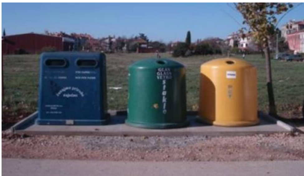
Slika 2. Primjer zelenog otoka

Općina Primorski Dolac će postaviti u prvoj fazi dva zelena otoka (6 posuda), čime će se zadovoljiti zahtjevi postavljeni u Planu gospodarenja otpadom Splitsko-dalmatinske županije. Međutim, s obzirom na raštrkanost zaseoka Općine i na financijske mogućnosti, do kraja 2016. godine postaviti će se još dva zelena otoka. Osim spremnika za papir i karton, staklo, plastičnu i metalnu ambalažu, potrebno je osigurati i spremnik za tekstil.