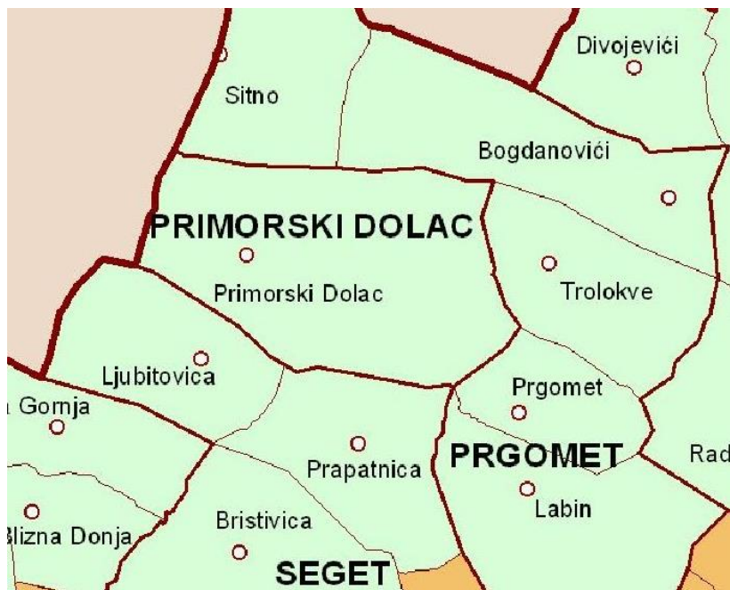
Slika 1. Položaj Općine Primorski Dolac

svjetskog rata bila poljoprivreda te je naseljavanje slijedilo logiku plodnih polja. Tako je naslijeđen sustav kojeg karakteriziraju mali i raspršeni zaseoci.